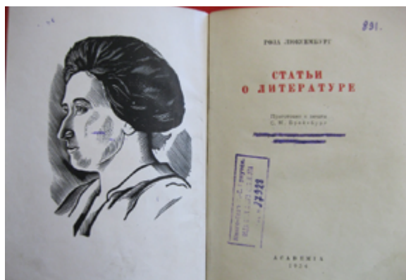
Рис. 6. Зачеркнутое имя И. М. Нусинова

и вступительная статья на месте, тогда как в других томах имя академика тщательно зачеркнуто фиолетовыми чернилами, а статьи вырезаны.