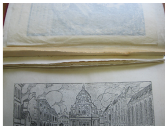
Рис. 5. Вырезанная статья В. И. Невского

Розы Люксембург «Статьи о литературе» (1934) тщательно зачеркнуто фиолетовыми чернилами имя Исаака Марковича Нусинова (1889–1950) 16 , составившего предисловие (рис. 6).