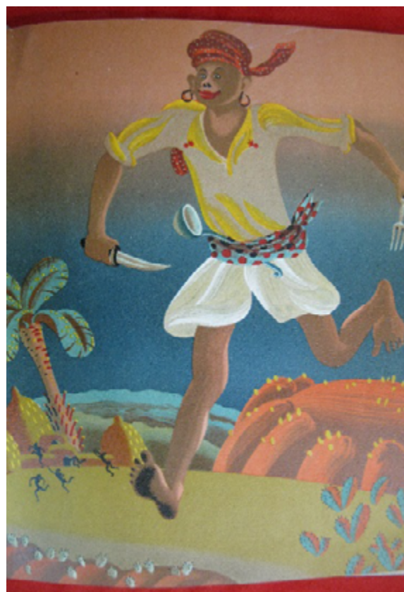
Рис. 3. Иллюстрация В. Конашевича к сказке К. Чуковского