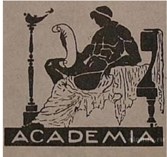
Рис. 1. Издательская марка

С 1929 по 1932 г. во главе издательства находился Петр Иванович Чагин (настоящая фамилия Болдовкин) (1898–1967) 5 , которого сменил Илья Ионович Ионов (1887–1942) 6 . Главным редактором «Academia» в эти годы был один из основоположников пролетарской литературы Анатолий Васильевич Луначарский (1875–1933), который в мае 1932 г. был утвержден ответственным редактором серий «Искусствоведение» и «Мастера стиля». В 1932 г. на смену И. И. Ионову, по рекомендации М. Горького, пришел Лев Борисович Каменев (1883–1936) 7 , который прослужил в этой