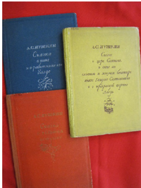
Рис. 2. Сказки А. С. Пушкина